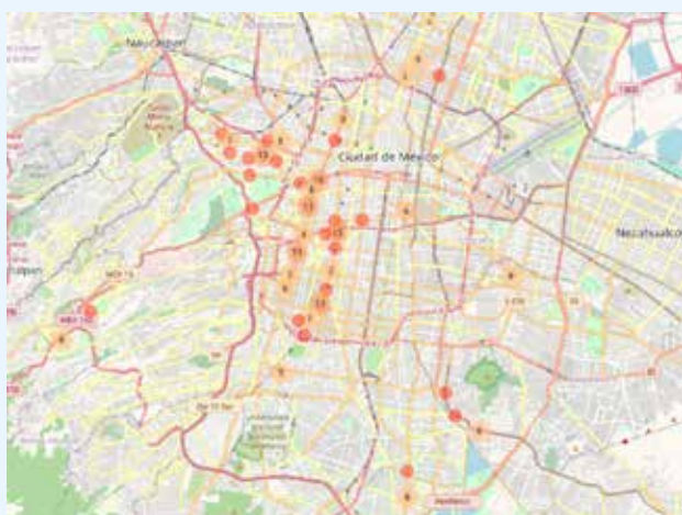
Repartidores que trabajan a través de aplicaciones en Ciudad de México (México)