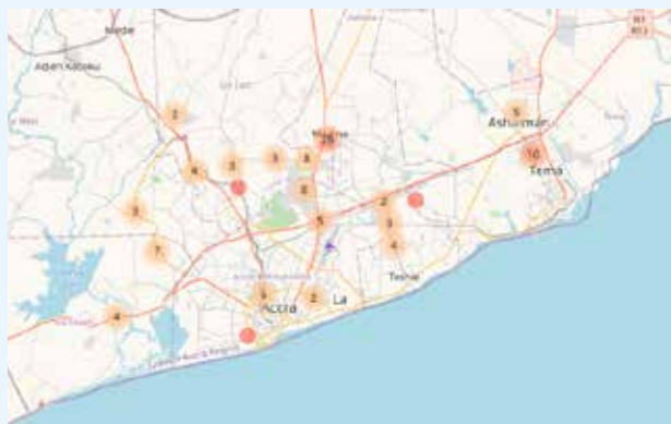
Taxistas convencionales en Accra (Ghana)