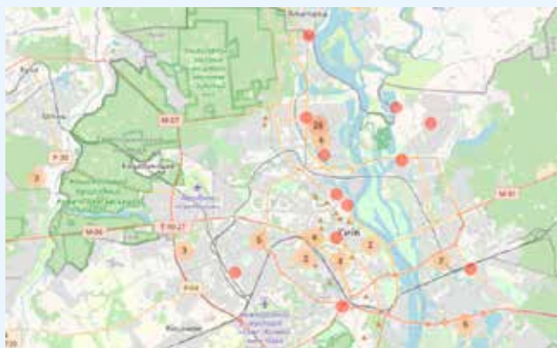
Conductores que trabajan a través de aplicaciones en Kiev (Ucrania)