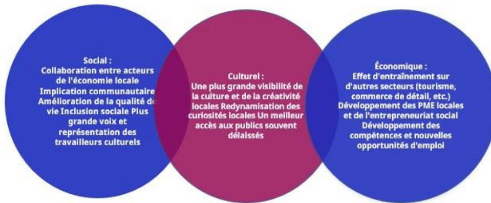
► Figure 1. L'impact multiple des unités d'ESS dans le lecteur culturel et créatif

Avant même la pandémie mondiale, les unités d'ESS du SCC ont été actives dans l'autonomisation des travailleurs, grâce à une amélioration des connaissances et des compétences couplée à un environnement de travail plus sûr et favorable (Costantini, 2018). Les coopératives et les unités d'ESS au sens large peuvent être encore renforcées dans le SCC en tant que modèles économiques et d'organisation de choix par le biais de coopératives de travailleurs, de collectifs d'artistes, de fiducies foncières communautaires et de réseaux d'entraide. Ces modèles bénéficient de la propriété communautaire et de la