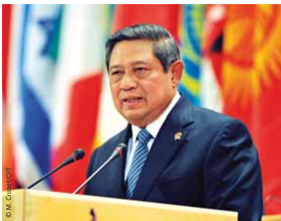
Presidente Susilo Bambang Yudhoyono durante su intervención en la 100.ª Conferencia Internacional del Trabajo (CIT) en Ginebra

“ LOS JÓVENES PUEDEN CONTRIBUIR SIGNIFICATIVAMENTE A LA PROSPERIDAD MUNDIAL. SE DEBE INVERTIR MÁS EN LOS SECTORES QUE GENERAN TRABAJO PARA LOS JÓVENES ”