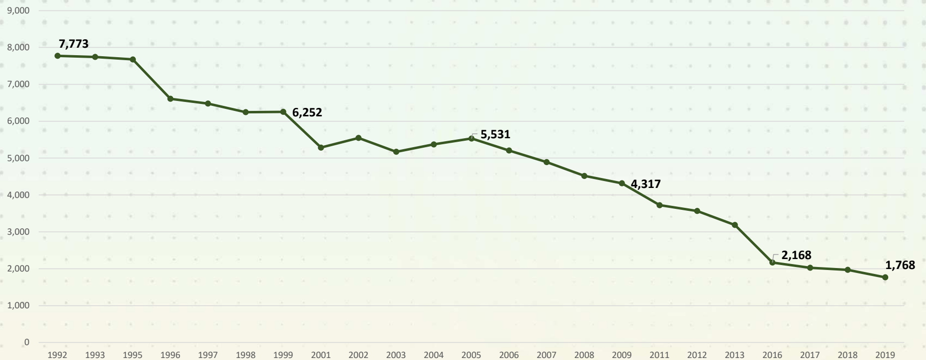
Aantal kinderen en jongeren van 5 tot 17 jaar die kinderarbeid verrichten in Brazilië