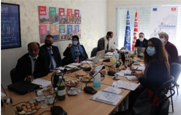
Webinaire régional sur les recommandations de Montréal sur le recrutement

Dans le cadre du renforcement de capacités des acteurs gouvernementaux en matière de recrutement éthique, l'OIM a organisé un webinaire régional, le 26 novembre 2020, en présence des principaux partenaires de THAMM, et ce afin de leur présenter les recommandations de Montréal sur le recrutement. Ces 55 recommandations sont le fruit de la conférence mondiale qui s'est tenue à Montréal en juin 2019, et qui fournissent aux gouvernements des conseils divers et pratiques pour permettre une réglementation plus efficace du recrutement international et de la protection des travailleurs migrants. Le webinaire a rassemblé une quarantaine de participant.e.s, dont des fonctionnaires gouvernementaux de la Tunisie, du Maroc et de l'Égypte, afin de faciliter les échanges entre pairs en termes de réglementation du recrutement et de protection des travailleurs migrants.