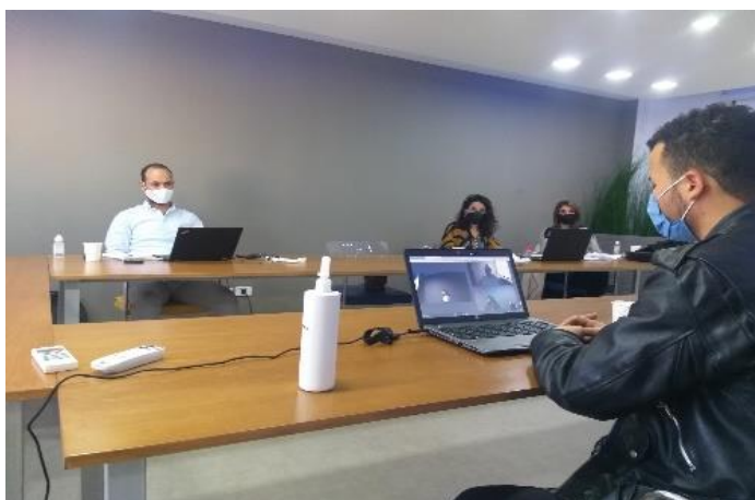
Entretiens de sélection THAMM